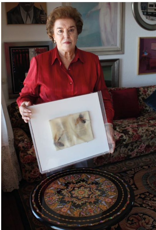
La coleccionista en un salón de su casa con un cuadro de José María Sicilia. Dibujo cera, 20x254 cms.