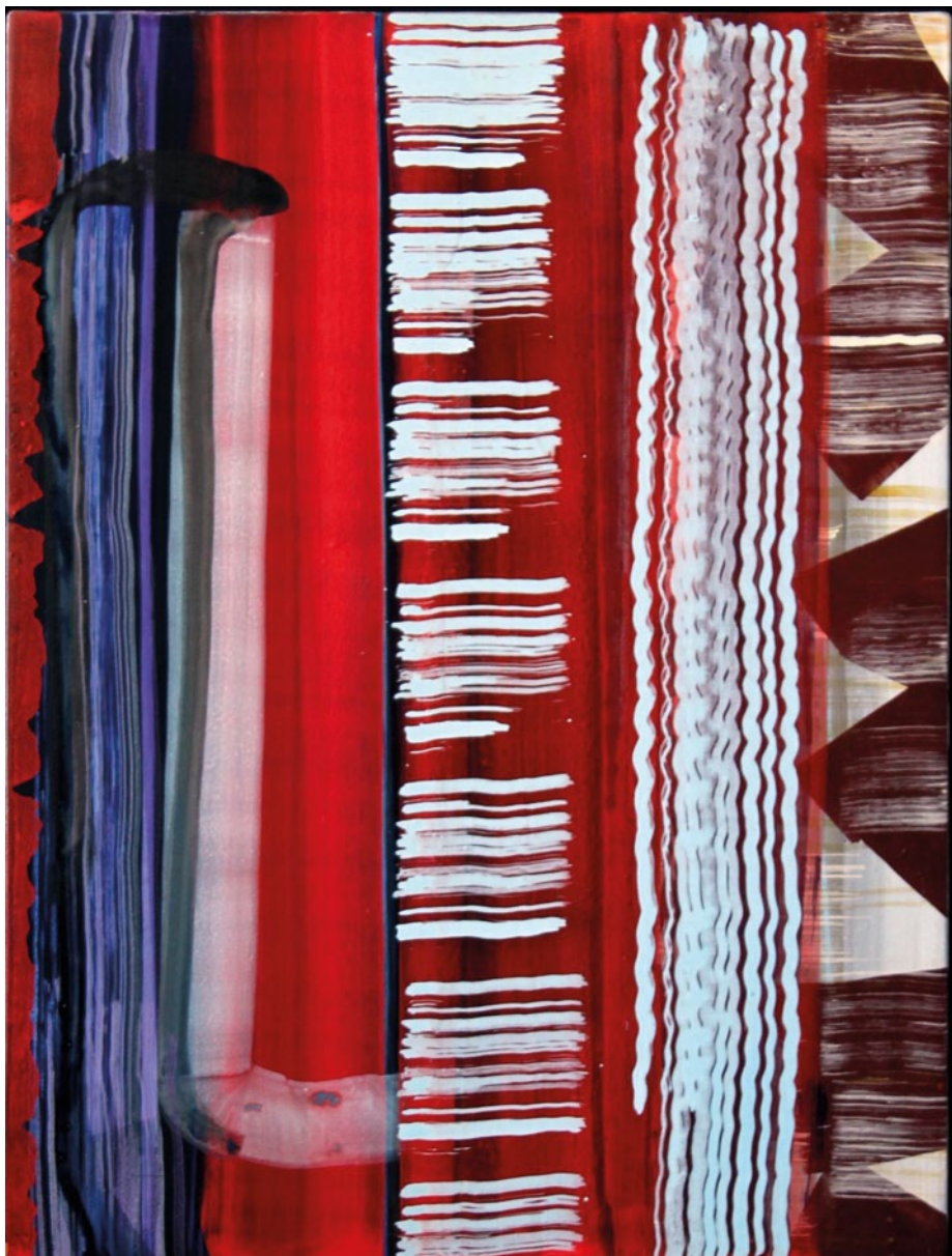
Juan Uslé "Intriga de sol y sombra" Óleo, vinílico y pigmento sobre lienzo, 76x56,7 cms.