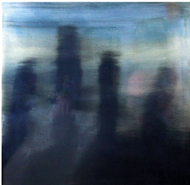
José Gallego "Cipreses" Pigmento y barniz sobre tabla, 40x40 cms.