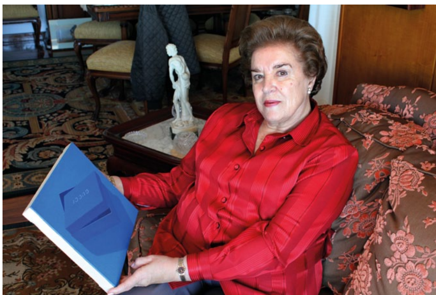
La coleccionista en un salón de su casa con un cuadro de Manuel Sáez. “Cepo M”, acrílico sobre lienzo, 25x35 cms.