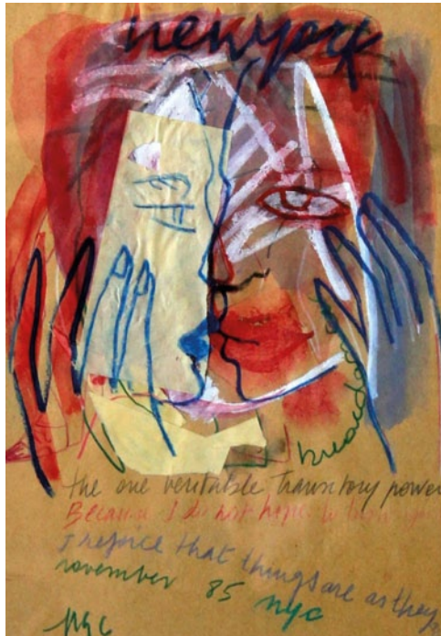
Pilar Cossio "Nueva York" Dibujo color, 34x25 cms.