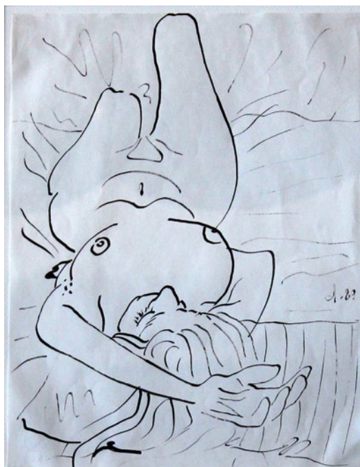
Jiri Dokoupil S/t Tinta sobre papel, 32x24 cms