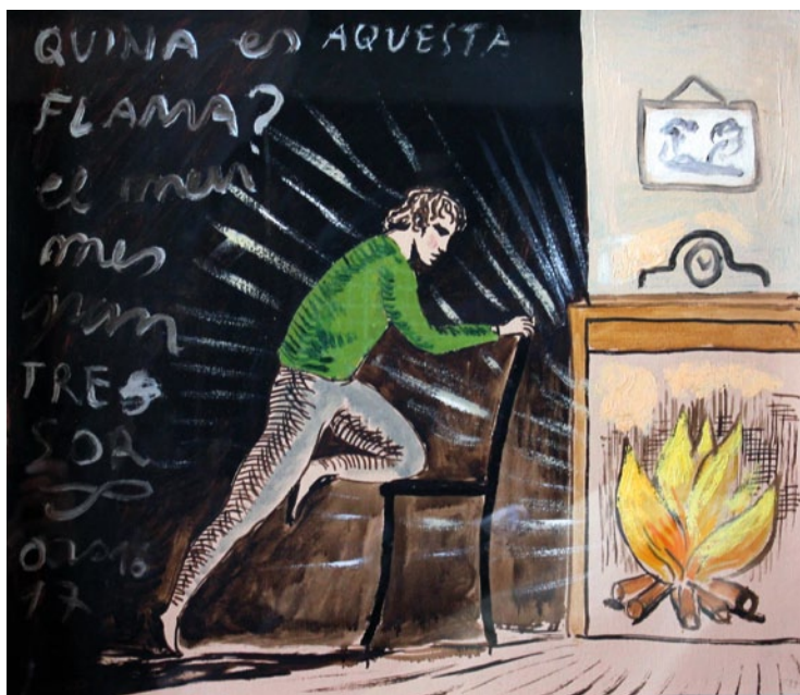
Oriol Villapuig S/t Óleo sobre lienzo, 45x51,5 cms.