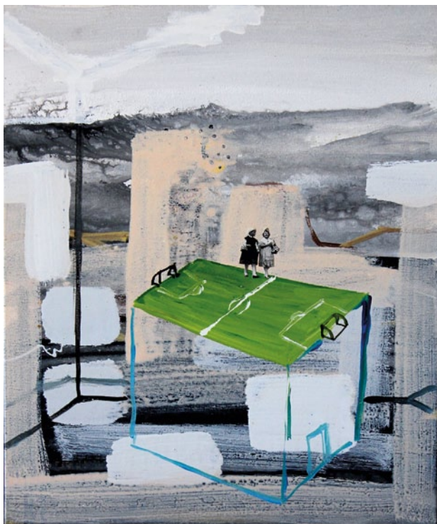
Juan Ugalde S/t Óleo sobre tela, 65x50 cms.