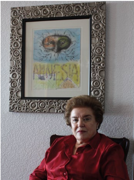
La coleccionista ante un cuadro de Chema Cobo. Dibujo collage, 41x31,5 cms.