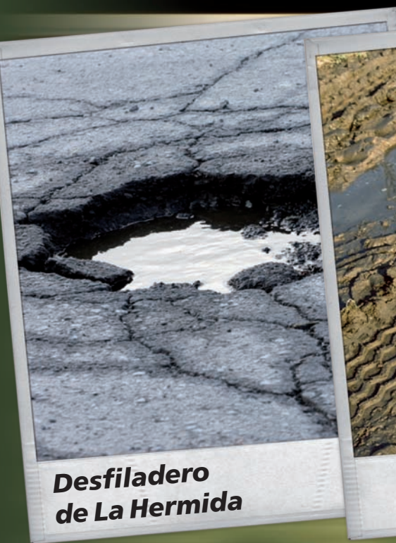
Desfiladero de La Hermida