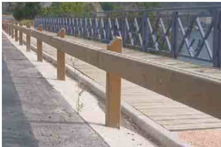
Detalle de barrera de seguridad mixta metal-madera

Propuesta de (*) pasarela en vuelo con barreras de seguridad mixtas metal-madera